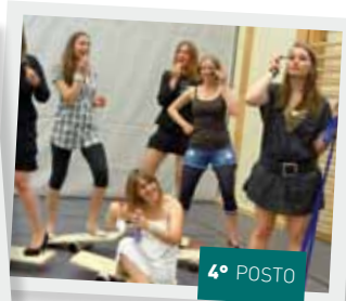
Trucco in equilibrio - da Entlebuch