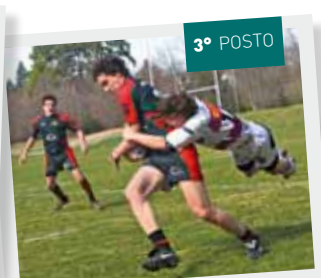
Nyon Rugby Club - da Colovray