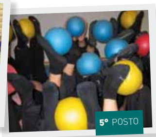
In forma insieme - da Schmitzen