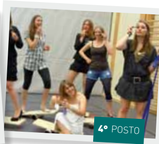
Trucco in equilibrio - da Entlebuch