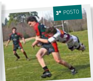
Nyon Rugby Club - da Colovray